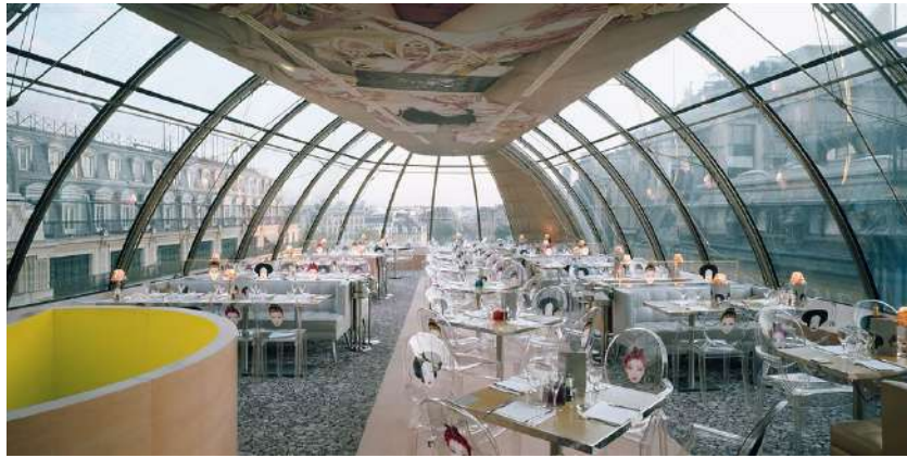
Kenzo Building Paris 1 e